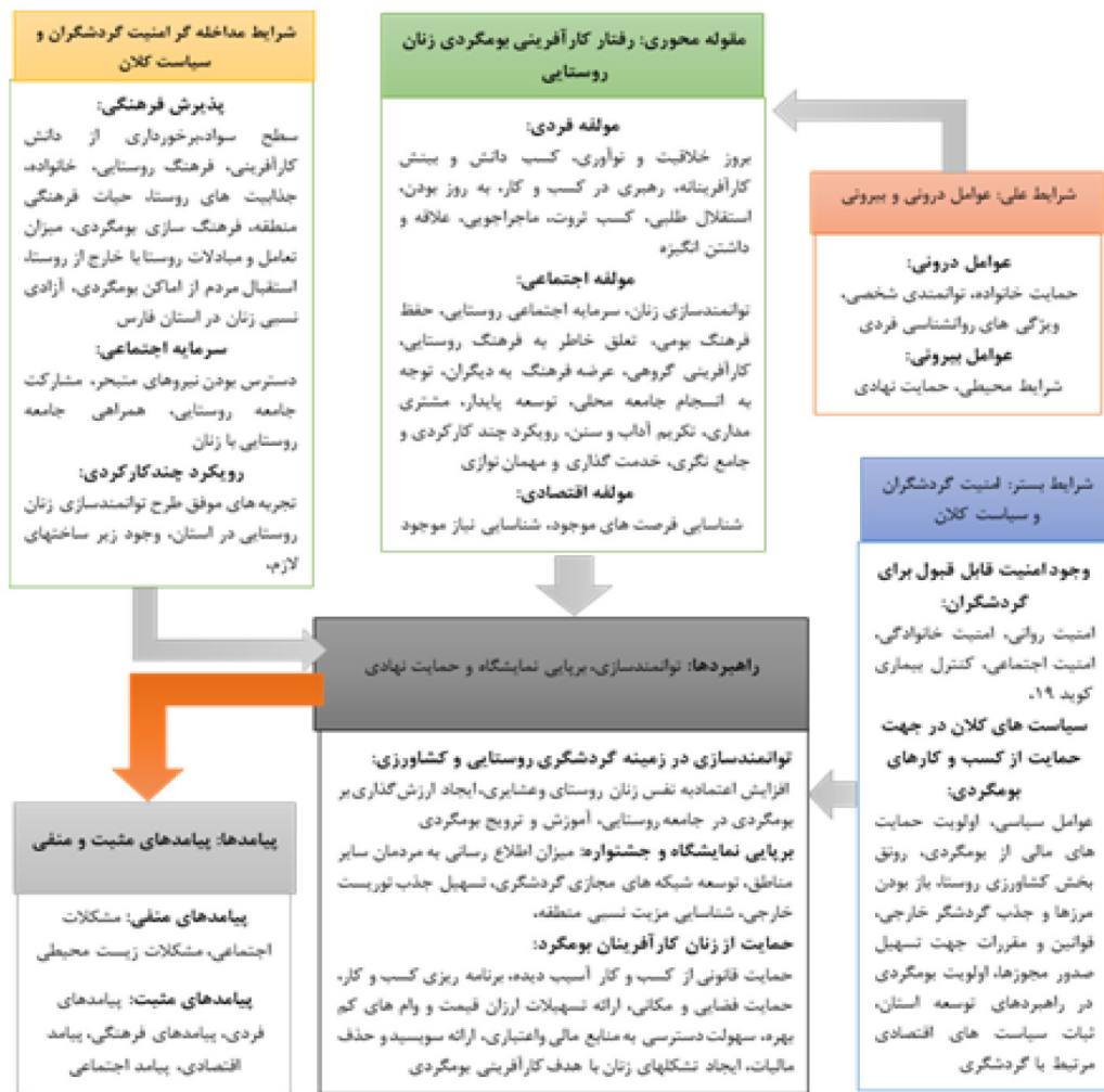
نمودار ۱: مدل پارادایمی رفتار کارآفرینی بوم‌گردی زنان روستایی استان فارس