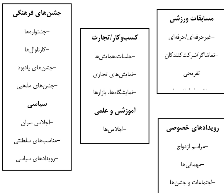
شکل ۱: گونه‌شناسی رویدادهای برنامه‌ریزی شده بر پایه انواع موضوعی آن‌ها (کانل و همکاران، ۲۰۱۵)

طبقه رویدادهای علمی و آموزشی به آموزش و تبادل اطلاعات و دانش می‌پردازند. رویدادها و جلسات با هدف آموزش، معمولاً با نام سمینارها، کارگاه‌های