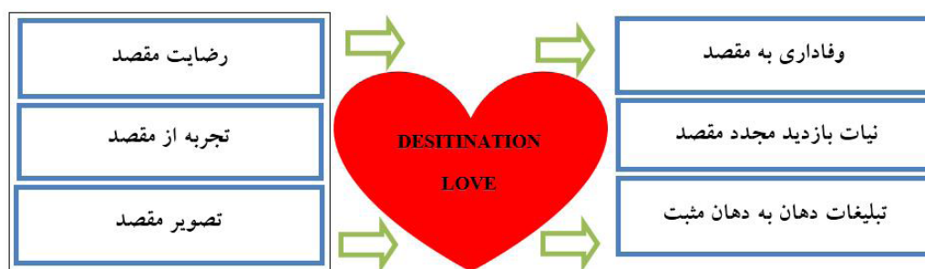
شکل ۴: چارچوب مفهومی عشق به مقصد براساس ادبیات

با توجه به بررسی ادبیات اشاره‌شده، چارچوب مفهومی عشق به مقصد به صورت ذیل ارائه می‌شود (که، در آن، پیشایندهای عملی و پیامدهای مهم مدیریتی را نشان می‌دهد):