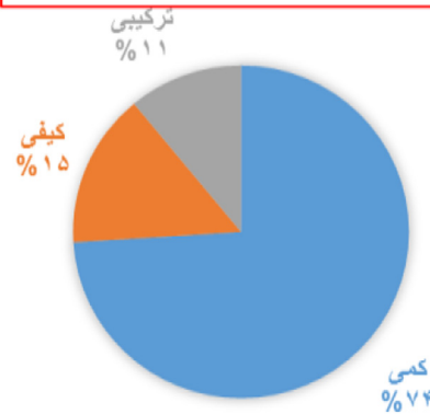
شکل ۱: رویکرد پژوهش در تحقیقات