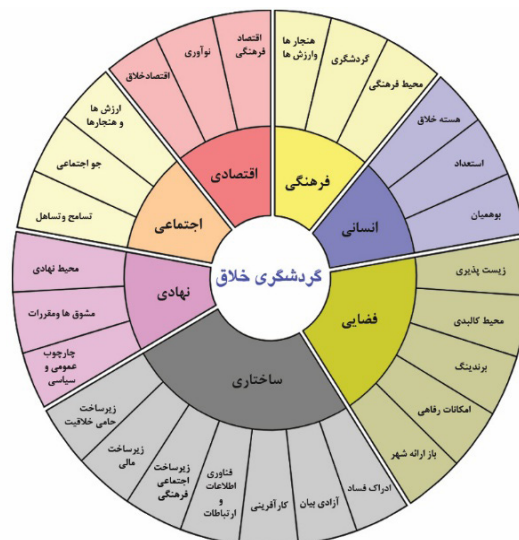
شکل ۳: الگوی گردشگری خلاق مبتنی بر رویکرد بازآفرینی فرهنگ‌محور

از میان عوامل شناسایی شده، پارادایم رمزگذاری محوری انجام شد و، براساس آن، ارتباط خطی میان رمزگذاری محوری و رمزگذاری انتخابی و مقوله اصلی مشخص شد. شکل زیر پارادایم رمزگذاری محوری و، به عبارت دیگر، الگوی چرخه پویای تعاملات بین رویکرد بازآفرینی فرهنگ‌محور، ایده شهر خلاق و گردشگری خلاق را نشان می‌دهد که از مطالعه کیفی پژوهش به دست آمده است.