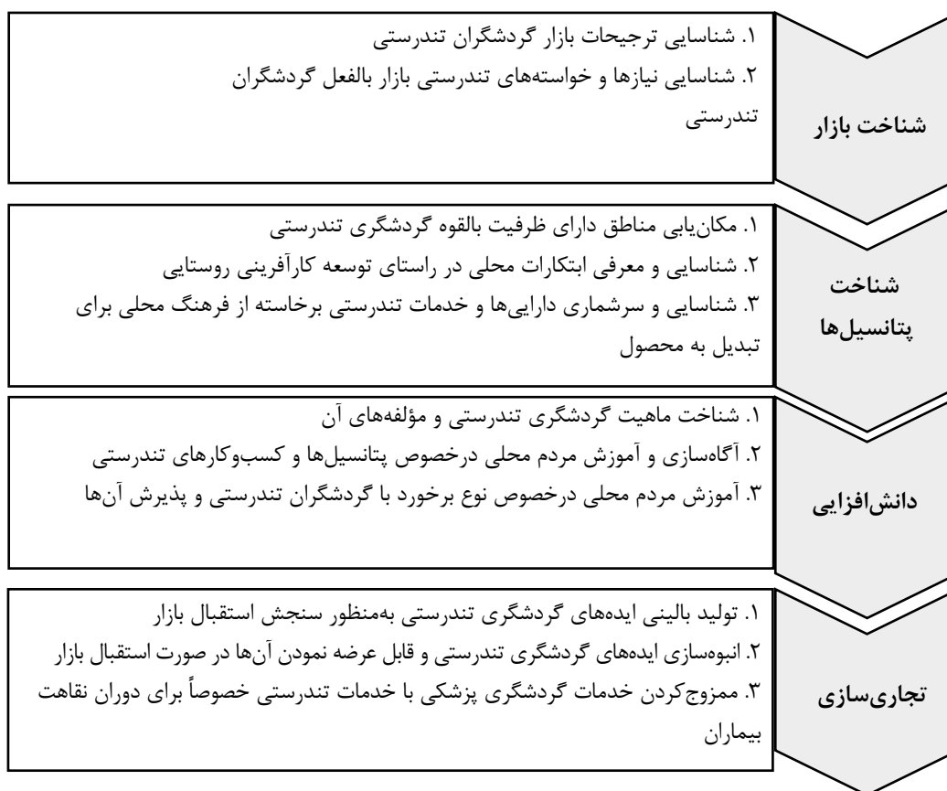
شکل ۲: فرایند شناسایی و تجاری‌سازی فرصت‌های کارآفرینی گردشگری تندرستی به‌عنوان هسته مرکزی مدل

با این حال، همان طور که شرح داده شد، بهره‌گیری از پتانسیل‌های سرشار کشور، در جهت توسعه کسب‌وکارهای گردشگری تندرستی، مستلزم طی کردن مراحل است که در قالب مقوله‌ای تحت عنوان «فرایند شناسایی و تجاری‌سازی» در بطن مدل نهایی پژوهش جای گرفته است. اگرچه مقوله مزبور ابعاد زیادی را مبتنی بر یافته‌های حاصل از مصاحبه‌ها دربر می‌گیرد، بنابر دانش و مطالعات و تجارب پژوهشگران در این پژوهش، غربال این ابعاد در نهایت مدلی را ارائه نمود که مراحل چهارگانه آن هرکدام شامل سه راهبرد کلی می‌شود که در شکل ۲ به‌وضوح ارائه شده است. در پیروی از دو مرحله آخر، توجه به این نکته ضروری است که مهم‌ترین پیش‌نیاز برای تجاری‌سازی پایدار خدمات گردشگری تندرستی در کشور جدی‌گرفتن این خدمات و تفریحی تلقی نکردن آن است؛ امری که در حوزه‌های یادشده، به‌خصوص در رابطه با جنگل‌ها، چشمه‌های آب‌گرم و معدنی، نواحی بیابانی و غارهای نمک موجود در کشور، از نگاه دست‌اندرکاران و فعالان گردشگری به‌طورکلی مغفول مانده و عواقب جبران‌ناپذیری را در پی خواهد داشت. حال آن‌که بهره‌گیری از این پتانسیل‌های سرشار در جهت توسعه گردشگری تندرستی، به‌واسطه تطبیق تبعات صنعت گردشگری تندرستی با موازین زیست‌محیطی، در کاهش تأثیرات منفی مذکور بسیار مؤثر خواهد بود.