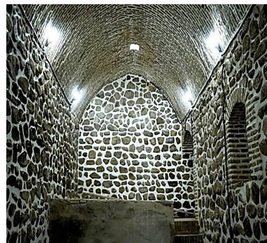
شکل ۲: تپه ازبکی (راست) و آسیاب آبی (چپ) دو نمونه از مکان‌های گردشگری شهرستان نظرآباد

را به دست آورده است و پس از آن آسیاب آبی، فرودگاه آزادی و خانه و خودرو مصدق با امتیازات یکسان قرار دارند.