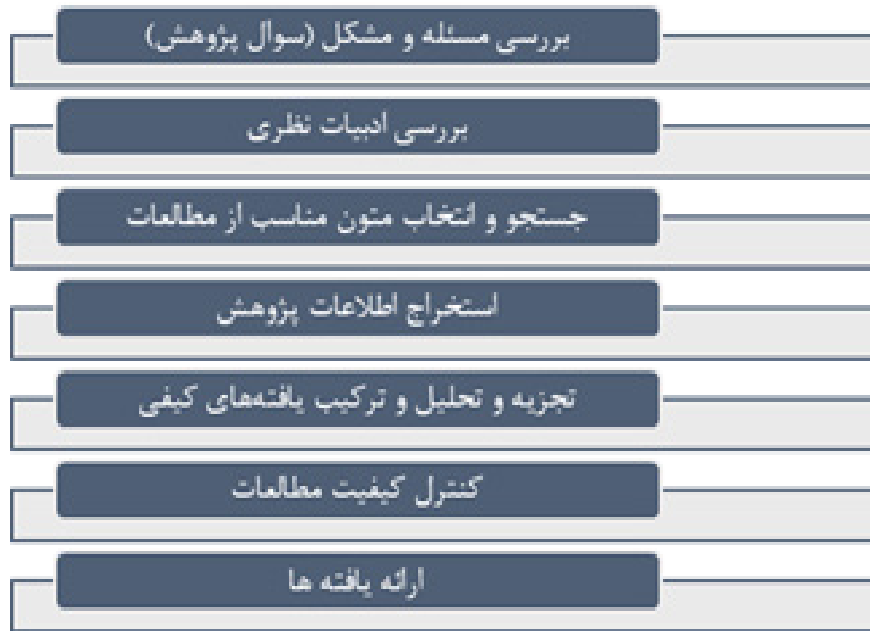
شکل ۱: الگوی هفت مرحله‌ای فراترکیب سندلوسکی و باروسو