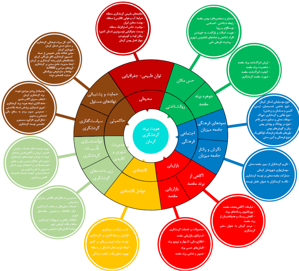
شکل ۲: نمایش کلی از الگوی هویت برند گردشگری شهر کرمان

الگوی نهایی هویت برند گردشگری شهر کرمان دارای هفت بعد اصلی است که در فرایند تجزیه و تحلیل شناخته