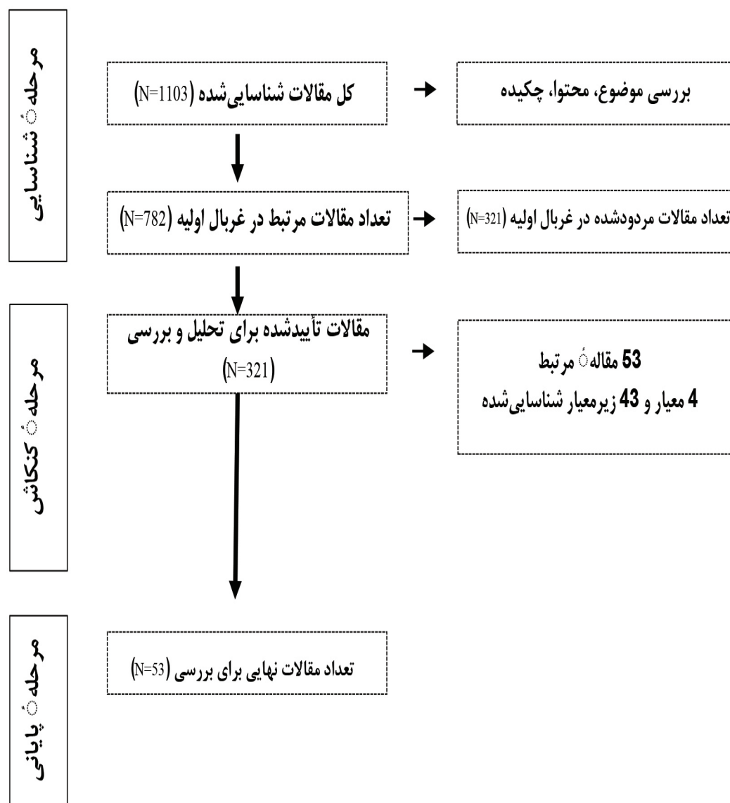
شکل ۲: فرایند استخراج مقالات و گزارش‌های مرتبط در مرحله کیفی مرور دامنه

بعدي، هريك از اين داده‌ها تجميع و گردآوری شدند تا خلاصه و نتیجه نهایی آن‌ها تنظيم شود. دامنه بررسی در جدول ۲ خلاصه شده است. گفتنی است كه جست‌وجوها به دو زبان فارسی و انگلیسی در دوره زمانی شهریور ۱۳۹۸ تا خرداد ۱۳۹۹ انجام شدند كه در نهایت ۵۳ مقاله مرتبط استخراج شدند.