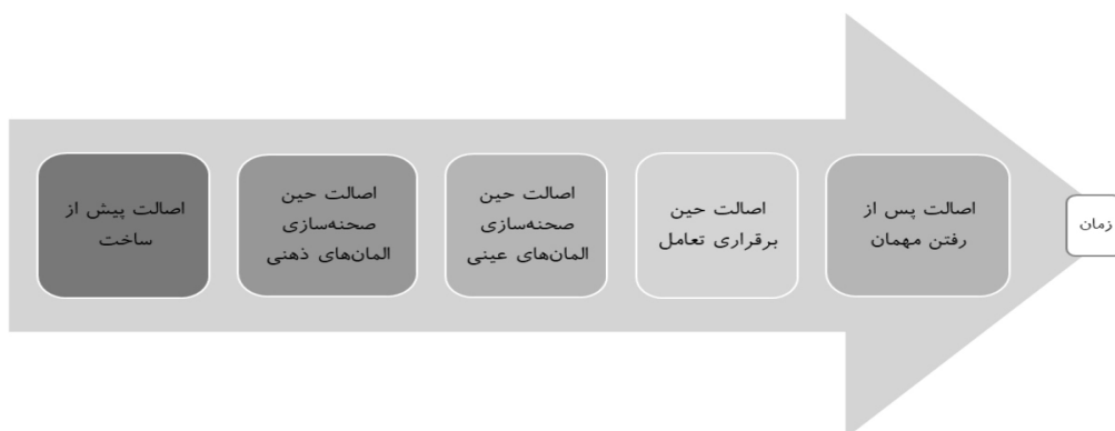
شکل ۱: فرایند عرضه اصالت در اقامتگاه بوم‌گردی براساس زمان عمر اقامتگاه

در این مطالعه نیز، اگرچه همه مقولات ماتریس تحلیل دارای زیرمقولات بودند، برخی از زیرمقولات در قالب هیچ‌یک از مقولات ماتریس تحلیل نگنجیدند. بنابراین، مقولات جدیدی با روش استقرایی از متون استخراج شدند. درنهایت، ۵ مضمون از بین ۳۵ مقوله استخراج شده کشف شد که در جدول ۲ ارائه شده‌اند.