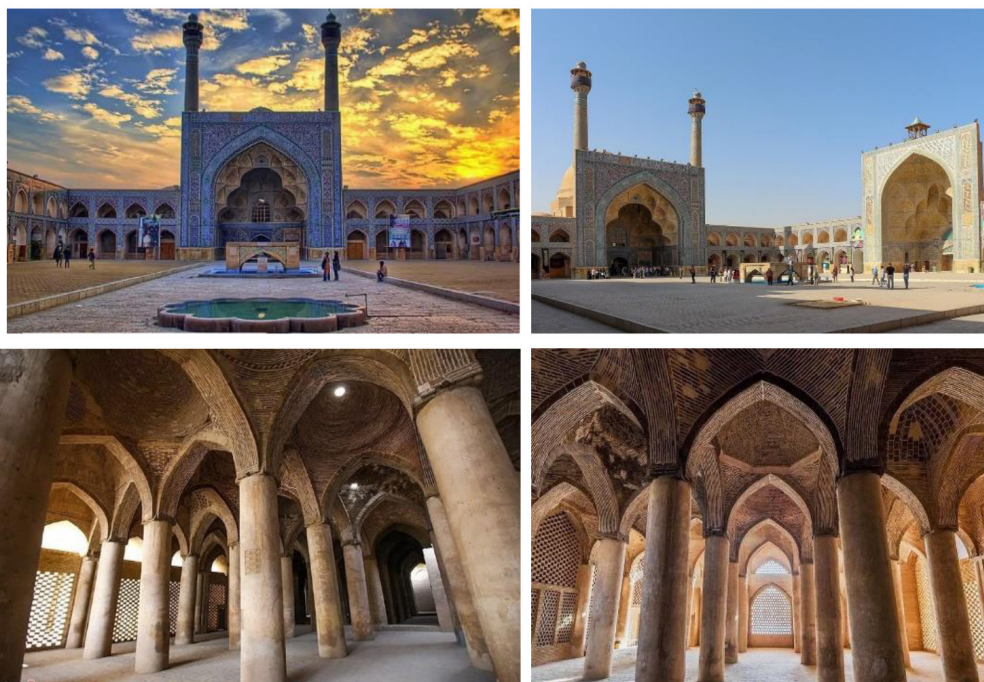
شکل ۲: مسجد جامع عتیق اصفهان

چهارایوانی را ارائه کرده و دربردارنده جزئیات بی‌شماری از هنر معماری ایران و ظرایف و ذخایر ارزشمند متعلق به هزارودویست سال تاریخ شهر اصفهان است و به همین دلیل آن را دایرةالمعارف هنر و موزه معماری ایران به شمار می‌آورند. گذشته از آن، وجود این بنا در بافت مرکزی اصفهان در خلال قرون و اعصار شکل‌دهنده معنویات عمیق و آیین‌ها و ارزش‌های معنوی با اعتقادات مذهبی عموم و پرورنده شخصیت‌های مهم علمی و مذهبی شهر است. به‌لحاظ پایگاه اجتماعی، این مسجد محل برپایی بسیاری از اجتماعات شهری و مذهبی است. بنا بر نظر کارشناسان معماری و تاریخ هنر در سراسر جهان، مسجد جامع عتیق اصفهان یکی از شاخص‌ترین بناهای معماری اسلامی در کل جهان به شمار می‌رود. شاهد این موضوع مطالب بسیاری است که در منابع مکتوب تاریخ معماری ذکر