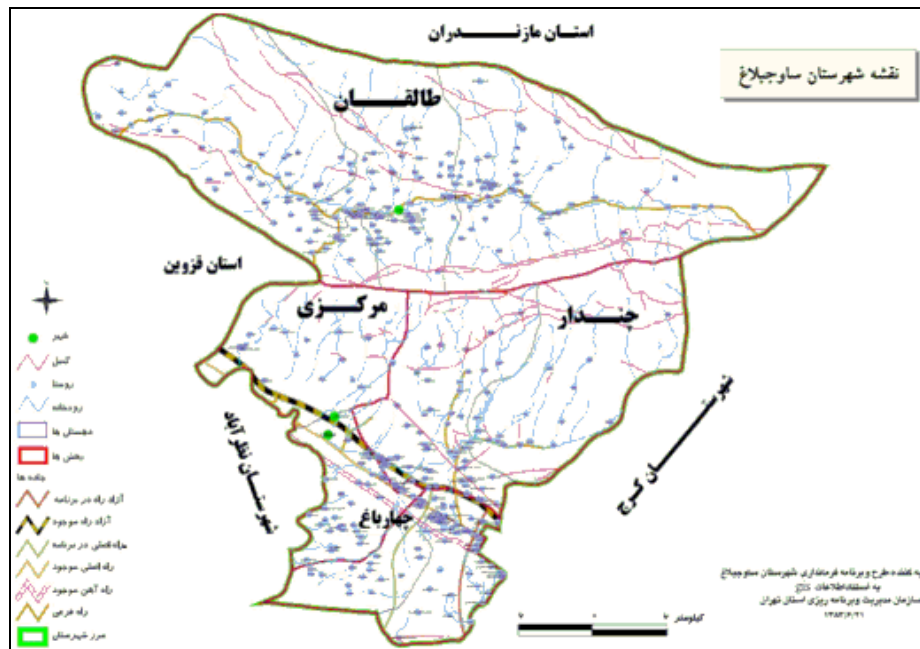
شکل ۲: موقعیت محدوده مورد مطالعه

منطقه شانس برابر برای انتخاب داشته‌اند. توزیع پرسش‌نامه در هریک از روستاهای یادشده براساس محاسبه نسبتی از جمعیت کل و همان نسبت از حجم نمونه بوده است. در چارچوب رهیافت سیستمی، بررسی عوامل تبیین‌کننده خدمات و تسهیلات گردشگری و تأثیر آن بر وفاداری و تمایل به بازدید مجدد گردشگران مستلزم شناخت و درک کافی از فرایند این اثرگذاری است. به همین منظور در پژوهش حاضر، درخصوص کیفیت اثرگذاری خدمات و تسهیلات گردشگری بر وفاداری گردشگران بحث و بررسی شده است. در شکل ۲ موقعیت جغرافیایی محدوده مورد مطالعه ارائه شده است.