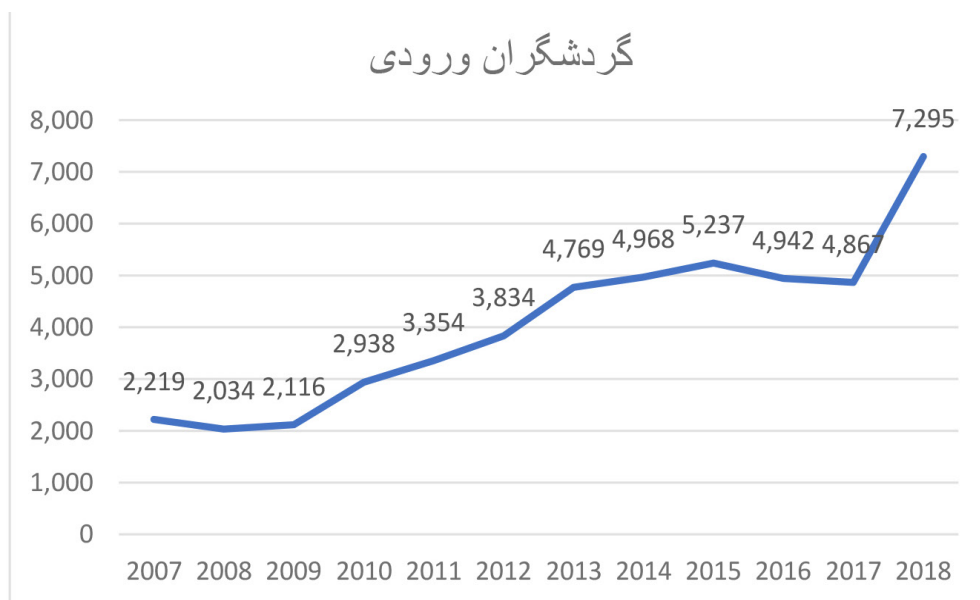
شکل ۲: میزان ورود گردشگر طی سال‌های ۲۰۰۷ تا ۲۰۱۸ (WTTC Data, 2020)

کرونا در اقتصاد را در مقایسه با سایر کشورها به مراتب افزایش می‌دهد؛ با توجه به اینکه وجه تمایز اقتصاد ایران در سال‌های ۱۳۹۸ و ۱۳۹۹ کرونا بوده، می‌توان تغییر ورود گردشگر به کشور در سال ۱۳۹۹ در مقایسه با ۱۳۹۸ را بیشتر متأثر از کرونا دانست.