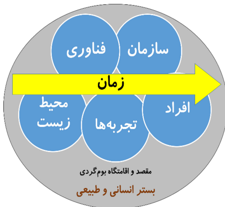
شکل ۲: چارچوب عوامل مؤثر در مدیریت امنیت در اقامتگاه‌های بوم‌گردی

در این پژوهش پس از تجمیع یافته‌ها، خلاصه‌سازی و نگاشت شبکه مضامین شش‌گانه، چارچوب عوامل مؤثر در تأمین، مدیریت و بهبود امنیت و ایمنی اقامتگاه‌های بوم‌گردی به شرح ذیل حاصل شد (شکل ۲).