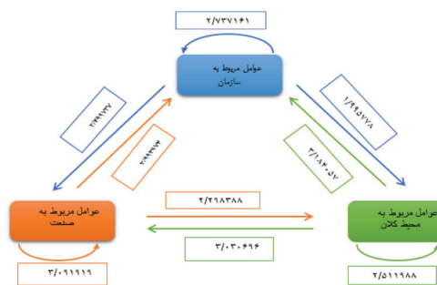
شکل ۲. دیگراف روابط غیرمستقیم توأم با شدت نسبی

عوامل معلول و تأثیرپذیر قطعی مطرح می‌شوند. به عبارت دیگر، عوامل مربوط به محیط کلان، در حکم عامل تأثیرگذار قطعی است و ۱ متغیر علت (اثرگذار) است. با توجه به نزدیک بودن به سمت چپ نمودار، عوامل مربوط به سازمان و عوامل مربوط به صنعت بیشترین اهمیت را در اثرگذاری دارند. در مجموع معیار عوامل مربوط به محیط صنعت در این ساختار به طور قطع تأثیرگذارترین عامل در مجموع سیستم در پذیرش شهروندی شرکتی در کسب و کارهای گردشگری است. دیگران دیگراف ارتباطات غیرمستقیم (شکل ۲) با توجه به جدول شدت روابط غیرمستقیم رسم شده است.