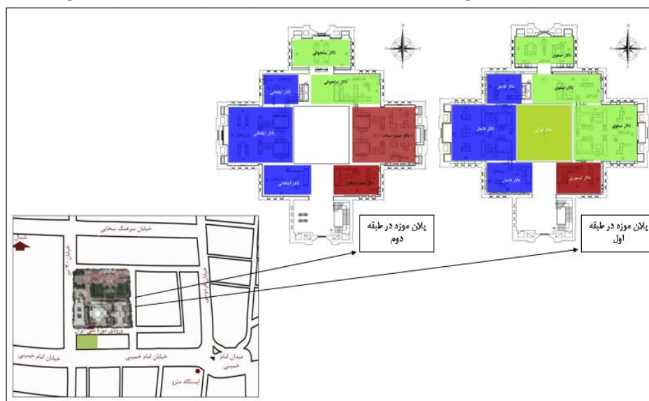
نقشه ۱: پلان موزه ملی در دو طبقه مجزا شامل موزه ایران باستان و موزه دوران اسلامی