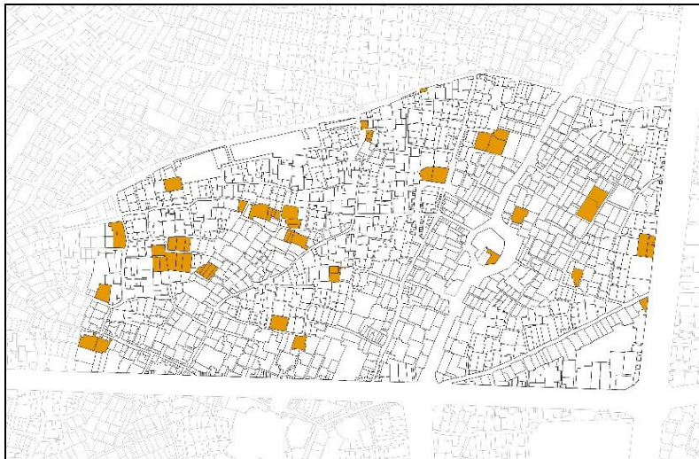
شکل ۳: بناهای تاریخی و باارزش محله علی‌قلی آقا

در حال حاضر ساختار محله تقریباً به همان قوت باقی است و کلیه عناصر کالبدی تعریف‌کننده یک محله با مرکز محله مشخص شامل بازارچه، مسجد و حمام (هرچند با تغییرات کالبدی و بعضاً حذف بخش‌هایی از این عناصر کالبدی) در آن وجود دارد. اما باتوجه به برخی تغییرات و خیابان‌کشی‌ها و نیز، از بین رفتن برخی عملکردها در طول زمان (مانند استفاده از حمام‌های عمومی و...)، از جنبه عملکردی، تغییراتی در ساختار محله ایجاد شده که در حال حاضر بیشتر جنبه گردشگری و گذران اوقات فراغت و فرهنگی به خود گرفته است.