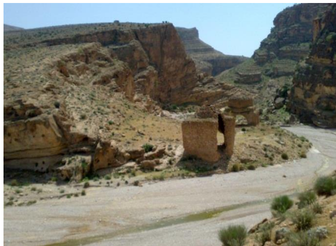
شکل ۲: تصویری از قصر تاریخی آینه

قصر آینه که به آن قصر دختر نیز گفته می‌شود در هشت کیلومتری بخش رستاق و در جنوب شرقی آن قرار دارد. این قصر تقریباً هفتاد کیلومتر از شهرستان داراب فاصله دارد که ۸ کیلومتر آن جاده خاکی و بقیه از داراب تا رستاق آسفالت می‌باشد حاکم این قصر همای دختر بهمن شاه ساسانی بوده و بدین سبب قصر دختر هم نامیده شده است. همچنین قصر آینه به دلیل تاریخی بودن و واقع شدن در ابتدای تنگ زیبای چک چک دارای پتانسیل‌های بالقوه زیادی برای جذب گردشگر می‌باشد.