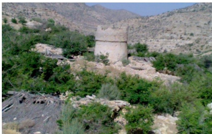
شکل ۵: نمایی از روستای قدیمی رزک

روستای رزک در شمال بخش رستاق و در جنوب شرق شهرستان داراب قرار دارد. ارتفاع این روستا از سطح دریا ۲۳۰۰ متر است. این منطقه اگر چه از نظر موقعیت جغرافیایی در قلمرو منطقه نیمه خشک قرار دارد اما به علت بلندی کوه‌های آن نسبت به مناطق همجوار بارندگی بیشتری جذب می‌کند همین بارندگی‌ها جهت رویش انواع گیاهان جنگلی و حیوانات وحشی و پرندگان را سبب شده است. بارندگی این منطقه حدود ۳۰۰ الی ۴۰۰ میلیمتر است و هوای تابستانهای آن خنک و زمستان بسیار سرد همراه با ریزش برف سنگین است. خنکی و مساعد بودن هوا و ریزش برف در فصل زمستان زمینه را برای کاشت و پرورش گیاهان دیم آماده کرده است. همچنین در این روستا یک برج دیدبانی مربوط به ۳۰۰ سال قبل قرار دارد. هر ساله گردشگران زیادی جهت بازدید از آثار گردشگری و اکوتوریستی به این روستا سفر می‌کنند.