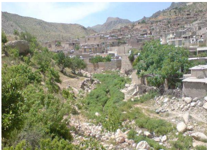
شکل ۶: نمایی از روستای زیبای لایزنگان

روستای لایزنگان از توابع بخش رستاق، شهرستان داراب واقع در استان فارس، در بین رشته کوه‌های جنوبی زاگرس قرار دارد. لایزنگان روستایی کوهستانی است و ارتفاع آن از سطح دریا ۲۰۰۰ متر است. لایزنگان به طور کامل شرایط و اوضاع جوی و اقلیمی یک نقطه میان کوهی را دارا است و از نقاط سردسیر شهرستان محسوب می‌گردد. سرمای آن در سردترین روزهای زمستان به دو الی سه درجه زیر صفر می‌رسد و در گرمترین روزهای تابستان از ۳۵ درجه سانتی‌گراد بیشتر نمی‌شود و بدین لحاظ دارای آب و هوای معتدل کوهستانی است و متوسط بارندگی آن معادل ۳۰۰ تا ۴۰۰ میلی‌متر است. مساعد بودن آب و هوای این روستا جهت کاشت باغات دیم اکوتوریسم زیبایی را در این منطقه خلق نموده است. و با توجه به دسترسی بهتر گردشگران به این روستای زیبا هر ساله شاهد بازدید گردشگران زیادی از این روستا می‌باشیم.