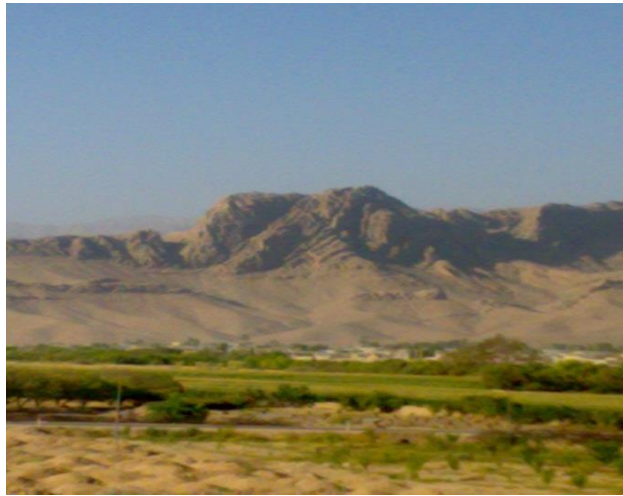
شکل ۱: نمایی از روستای سرسبز رستاق

باعث جذب گردشگران زیادی به این روستا شده است.