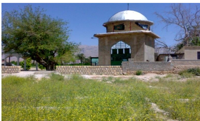
شکل ۳: نمای بیرونی مقبره امام زاده امیر عباس

امام زاده امیرعباس یکی از امیران امام حسن مجتبی (ع) می‌باشد که جهت گسترش دین اسلام به این منطقه سفر کرده بود. حکومت وقت که دین زردتشت داشته در مقابل پذیرش اسلام مقاومت می‌کند و در جنگی که بین نیروهای حکومت که در پشت کوه قلات مستقر بودند و آقا امیر عباس در می‌گیرد، امیرعباس کشته می‌شود ولی یارانش موفق می‌شوند نیروهای حاکم وقت را شکست داده و دین اسلام را در بین آنها گسترش دهند. لازم به ذکر است که در حال حاضر مقبره آقا امیر عباس در مرکز بخش رستاق قرار دارد و هر ساله عده زیادی از مردم روستاهای اطراف و به خصوص مردم رستاق به زیارت آرامگاه ایشان می‌آیند.